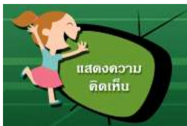
ภาพที่ 2 แสดงไอคอนเมนู แสดงความคิดเห็น

เป็นช่องทางสำหรับให้ผู้ใช้สามารถแสดงความคิดเห็นไปยังเจ้าหน้าที่ผู้ดูแลรายการถ่ายทอดสดได้ โดยเมื่อผู้ใช้งานคลิกที่เมนูแสดงความคิดเห็น ระบบจะแสดง Pop Up φόρมการแสดงความคิดเห็นให้แก่ผู้ใช้งาน