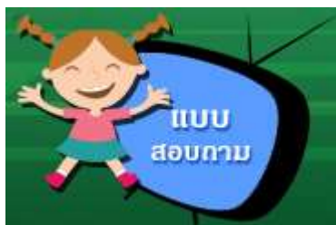
ภาพที่ 9 ไอคอนเมนู แบบสอบถาม

เป็นเมนูแสดงแบบสอบถามของเว็บไซต์ สำหรับให้ผู้ใช้งานเข้ามาร่วมตอบแบบสอบถาม เพื่อที่ทางหน่วยงานสามารถเก็บข้อมูลจากแบบสอบถามนี้ไปพัฒนาในเรื่องต่าง ๆ ต่อไป