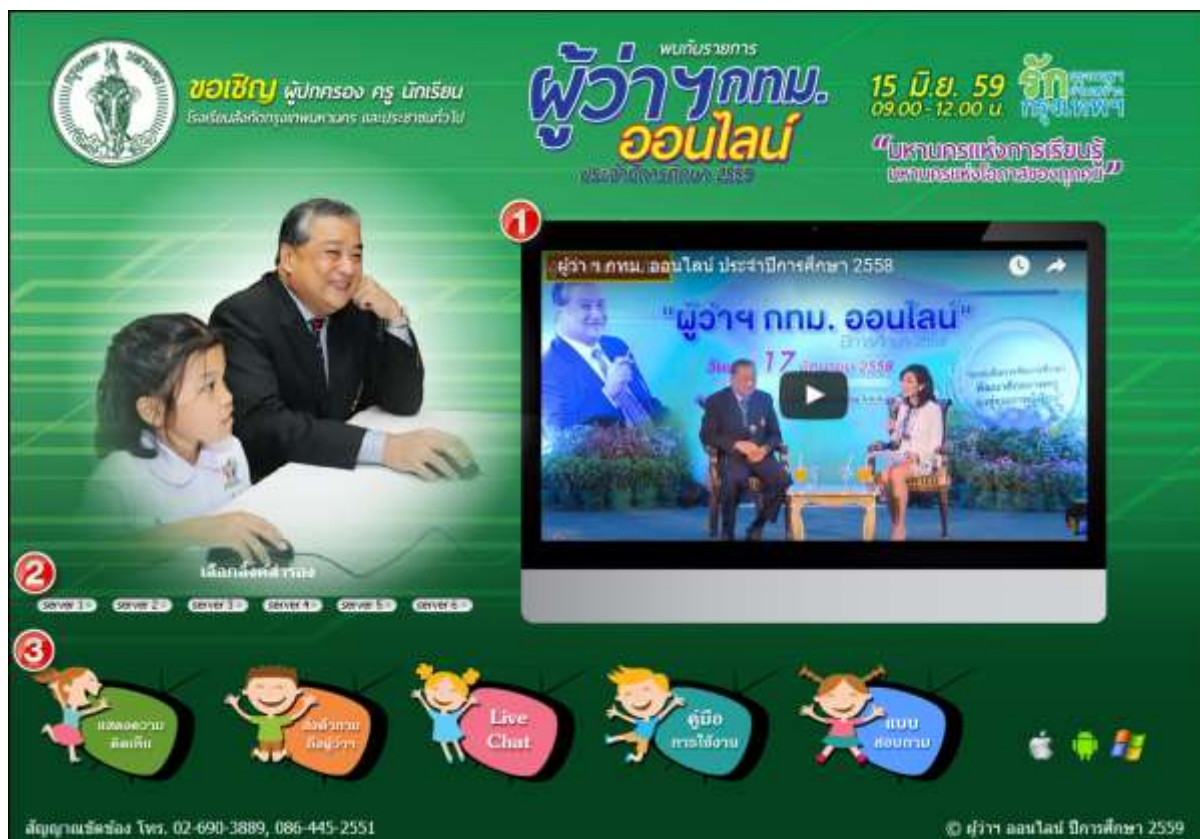
ภาพที่ 1 หน้าจอหลักเว็บไซต์