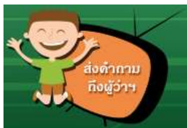
ภาพที่ 4 แสดงไอคอนเมนู ส่งคำถามถึงผู้ว่าฯ

เป็นช่องทางการส่งคำถามข้อสงสัยไปยังท่านผู้ว่าฯ กทม. โดยเมื่อผู้ใช้งานคลิกที่เมนูส่งคำถามถึงผู้ว่าฯ ระบบจะแสดง Pop Up ฟอรมการส่งคำถามให้แก่ผู้ใช้งาน