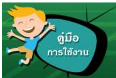
ภาพที่ 8 ไอคอนเมนู คู่มือการใช้งาน

เมนูคู่มือการใช้งาน เป็นเมนูสำหรับให้ผู้ใช้งานเว็บไซต์สามารถเข้ามาเรียนรู้และดาวน์โหลดคู่มือการใช้งานของเว็บไซต์เพื่อให้อ่านการใช้งานเว็บไซต์ได้อย่างถูกต้อง