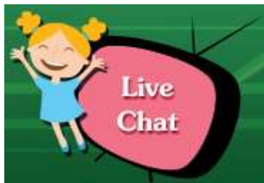
ภาพที่ 6 แสดงไอคอนเมนู Live Chat

เป็นเมนูสำหรับพูดคุยกับผู้ใช้งานอื่นหรือผู้ดูแลระบบได้แบบ Real Time โดยเมื่อผู้ใช้งานคลิกไอคอนเมนู Live Chat ระบบจะเข้าสู่หน้าฟอร์มการพูดคุย ผู้ใช้งานสามารถกรอกชื่อของตนเอง, ข้อความที่ต้องการสนทนา และสามารถส่ง Emoticon ได้